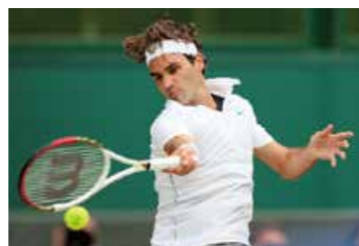
体の軸を保ち打点を前でとらえるフェデラー選手