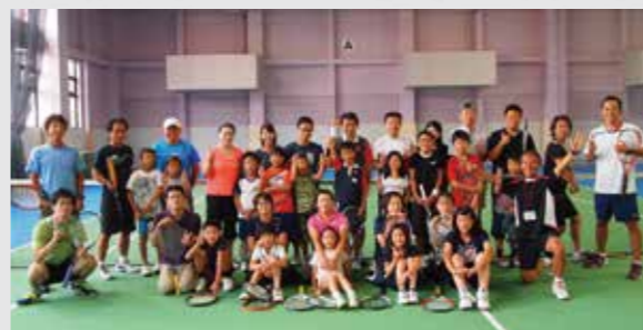
親子テニス教室に参加された皆様

8月13日(木)と9月23日(水)に、親子テニス教室が行われました。 レッスン当日は、親子で一糸懸命ボールを打ちながら、自然と笑顔があふれてくる様子を見ることが出来ました。 たくさんのご参加、誠にありがとうございました。