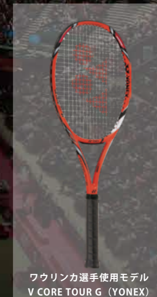
ワウリンカ選手使用モデル V CORE TOUR G (YONEX)

仙川店では新品、中古ラケットを数多く揃えて皆様のご来店をお待ちしております。自分に合うラケットが分からなくて悩んでいる方、スタッフが今のプレースタイルや、今後目指すプレースタイルをお伺いしながら、ご要望に合う1本をお探しします！是非ご来店下さい！