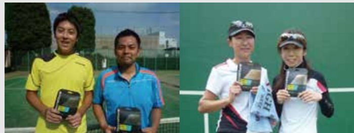
前回男子優勝ペア